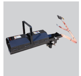
Canal giratorio con calefacción opcional