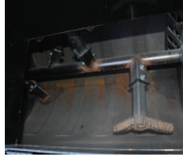
Paletas de agitación inclinadas y en ángulo para una mezcla completa del material y para sostener la suspensión de agregados