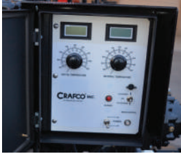
Controles digitales para exactitud de la temperatura