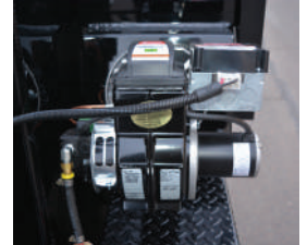
Quemador de bajo consumo de combustible y de fácil acceso