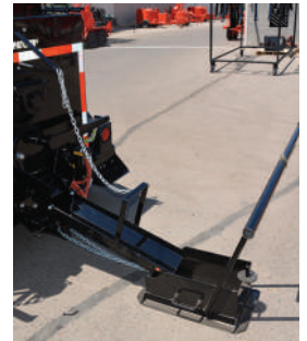
Caja de arrastre

Las patcher están equipadas con un cierre automático en la tapa, lo que proporciona tanto la eficiencia del fusor como la seguridad de los operarios. El Patcher II está equipado con una escotilla vertical, que permite que la olla de colada cubra completamente la abertura, atrapando el calor dentro de la máquina, lo que permite que la masilla restante drene hacia el fundidor.