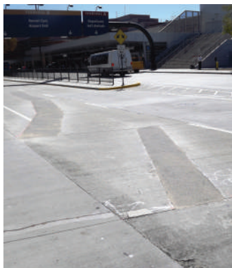
Aeropuerto Internacional Mineta San Jose — Foto Después