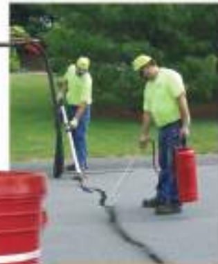
Sellador Ahulado Crafcó para verter en caliente